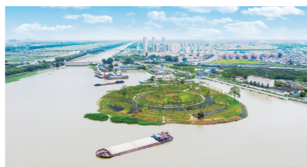
整治提升后的汇行广场