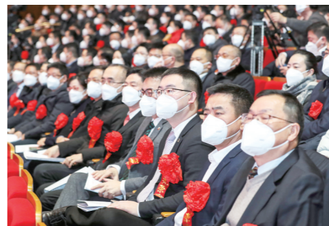
受表彰的企业、单位代表和个人在会场前排中间位置就座

十大精神的开局之年,淮安与全国全省同步迈上了中国式现代化新征程,同时也迈上了践行总书记嘱托10年再出发的新征程。我们要把总书记的巨大关怀转化为开启新征程、开创新事业的强大动力,坚定追逐中心城市复兴梦想,创造更多展示“象征意义”的实践成果。我