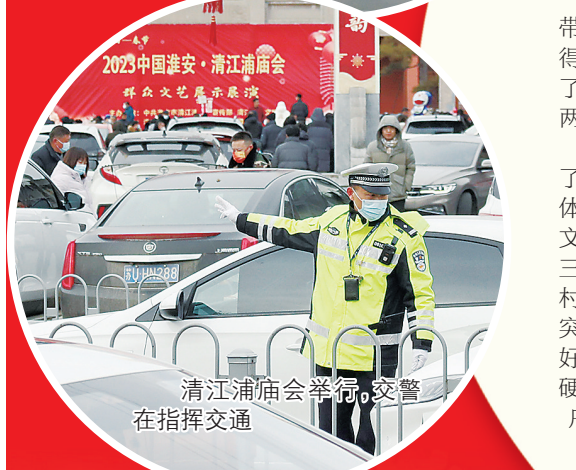
清江浦庙会举行,交警在指挥交通