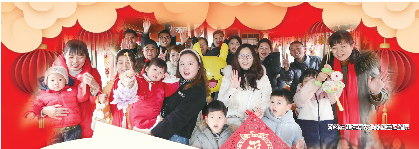
游客在里运河文化长廊景区游玩