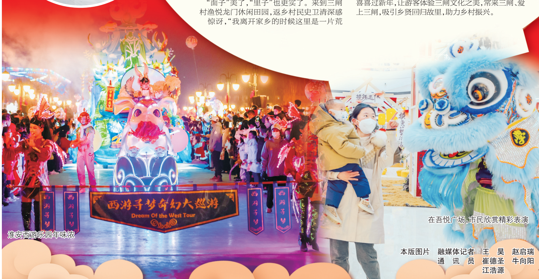
在吾悦广场,市民欣赏精彩表演