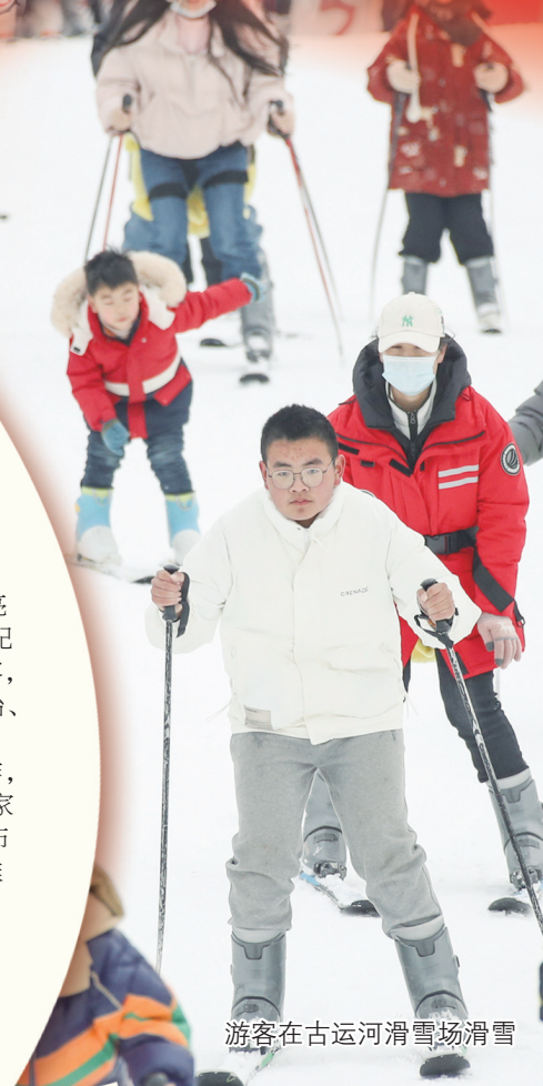
游客在古运河滑雪场滑雪

近年来,市委市政府高度重视古黄河保护建设工作,2016年制定出台保护条例。淮河生态经济带上升为国家发展战略后,为进一步优化古黄河沿线空间、产业等布局,丰富生态文旅水城内涵,2021年我市编制《江苏省淮安市古黄河生态发展带研究规划》,《规划》确定了打造“中国淮河文化承载区、淮安市生态文明示范走廊”的总体定位。根据《规划》内容,我市于2022年启动实施古黄河生态休闲带开放连通工程,全部完工后,将从东到西串联起古淮河湿地公园、樱花园、中国南北地理分界线标志园、桃花坞、柳树湾、动物园等10个生态公园,形成一条长约40千米的城市绿脉和辐射43平方千米的“十五分钟社区生活圈”,为沿线居民提供更加开放、绿色、舒适的休闲活动空间。