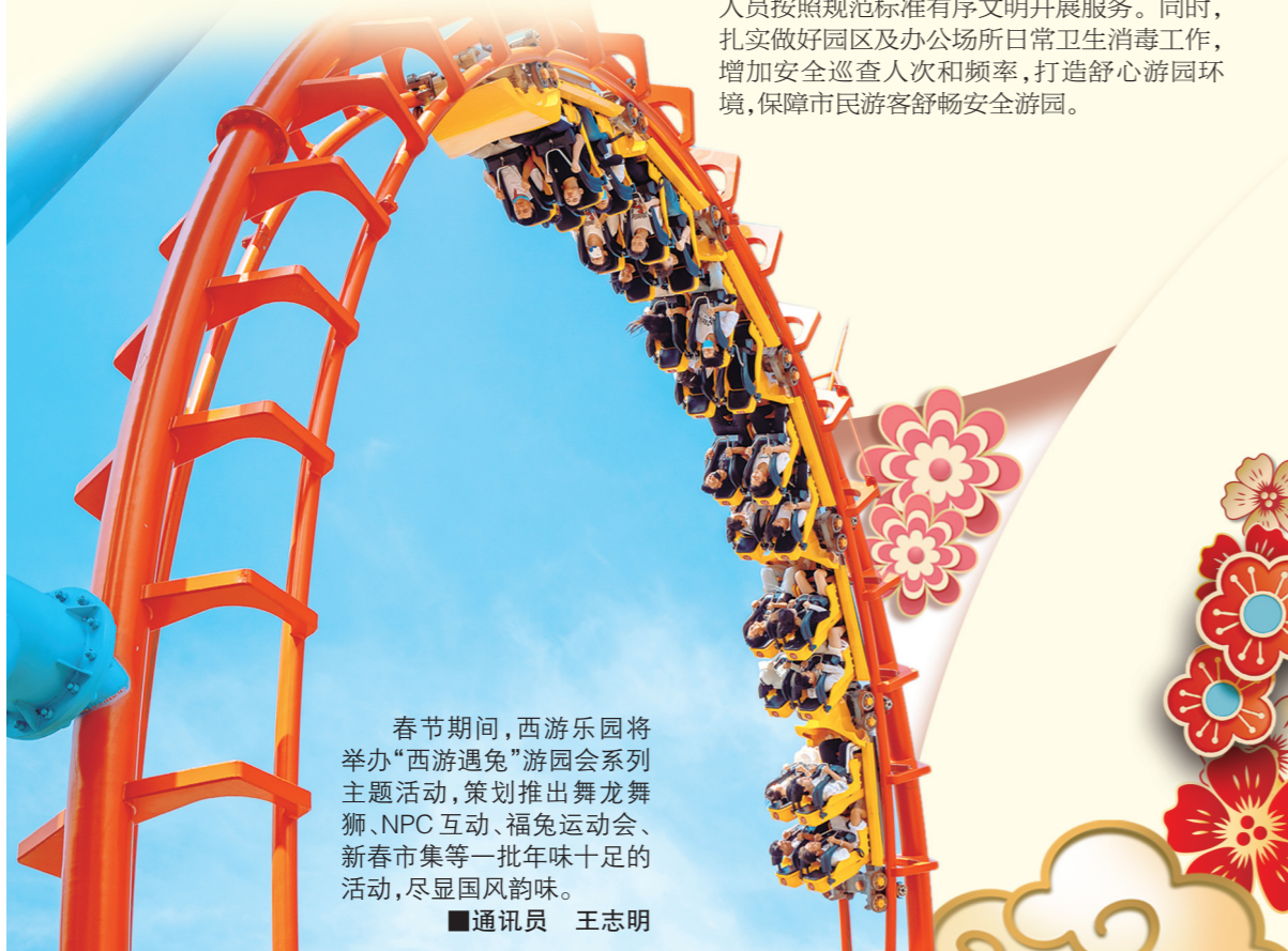
春节期间,西游乐园将举办“西游遇兔”游园会系列主题活动,策划推出舞龙舞狮、NPC互动、福兔运动会、新春市集等一批年味十足的活动,尽显国风韵味。 ■通讯员 王志明