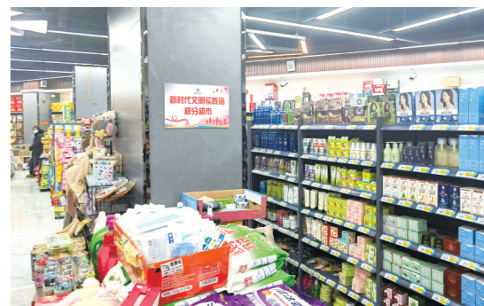
站前社区打造新时代文明实践站积分超市,让文明新风深入人心