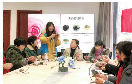
滨河社区新时代文明实践站巾帼公益坊开展“巧手微景观 扮靓家庭院”手工活动

如今,一个个理论阵地、一场场暖心服务、一件件民生实事,都诠释着淮安生态文旅区的文明指数,推动着全区综合承载力、文化吸引力、文明向心力向高处迈进,为淮安追逐城市复兴梦想注入不竭动力。