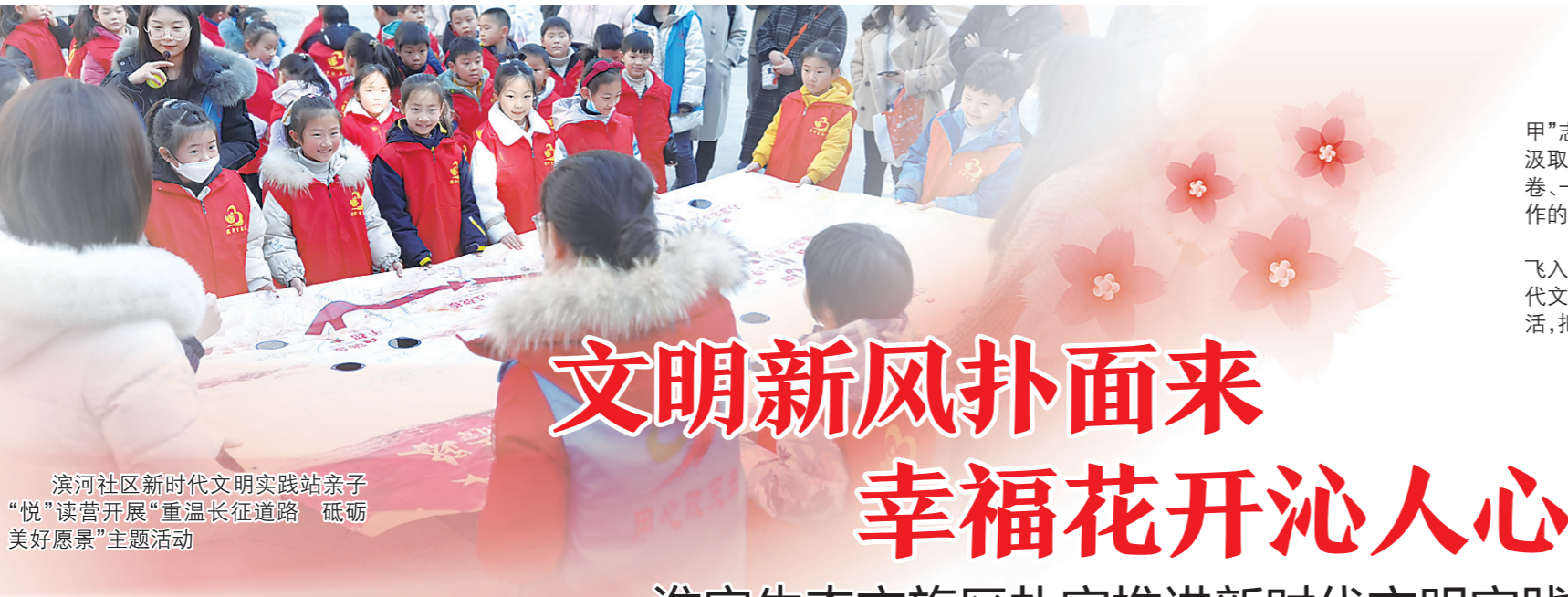
滨河社区新时代文明实践站亲子“悦”读营开展“重温长征道路 砥砺美好愿景”主题活动

记者留意到,超市内的糖果、坚果、饮料、水果等商品非常受欢迎,市民的购物车被新春商品填得满满当当,大家脸上洋溢着幸福的笑容。