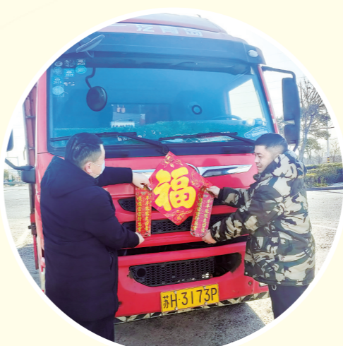
在新春佳节来临之际,淮安市公路事业发展中心倾心打造“年味儿”公路,为出行群众送上新年“福气”。图为,近日,在公路驿站,公路人为司乘人员送上对联和福字。 ■通讯员 耿 蓓 王晨晨 胡芷睿