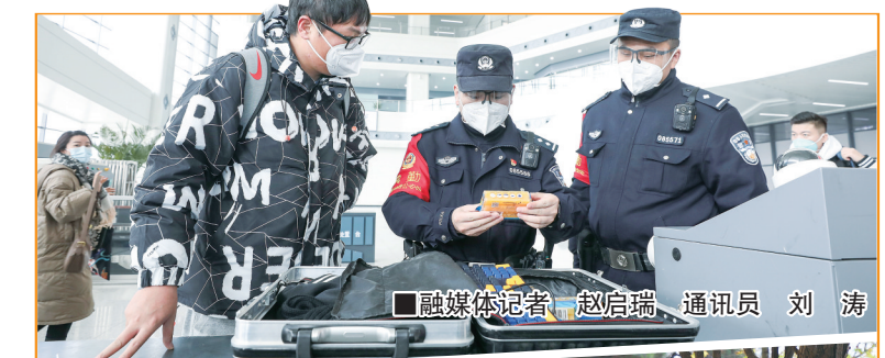
融媒体记者 赵启瑞 通讯员 刘涛

据介绍,春节假期(2023年1月21日至27日),市民可免费乘坐淮安有轨电车,清江浦区、淮安经济技术开发区、淮安生态文旅区、淮安工业园区以及淮安区、淮阴区部分城镇的城市公交也将为市民提供免费出行服务。