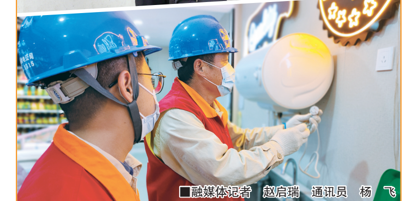
融媒体记者 赵启瑞 通讯员 杨飞