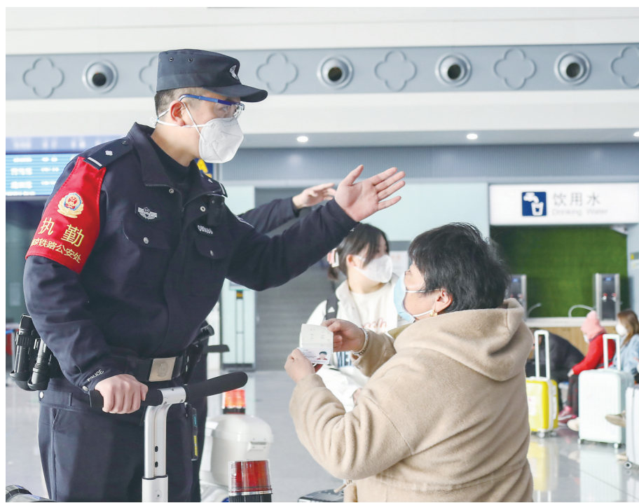
淮安东站昨迎出行高峰

“项目为王、环境是金”。淮安营商环境的含金量，正是由一个又一个像惠企“码上贷”这样的好产品、好服务累积起来的。（薛吉羊）