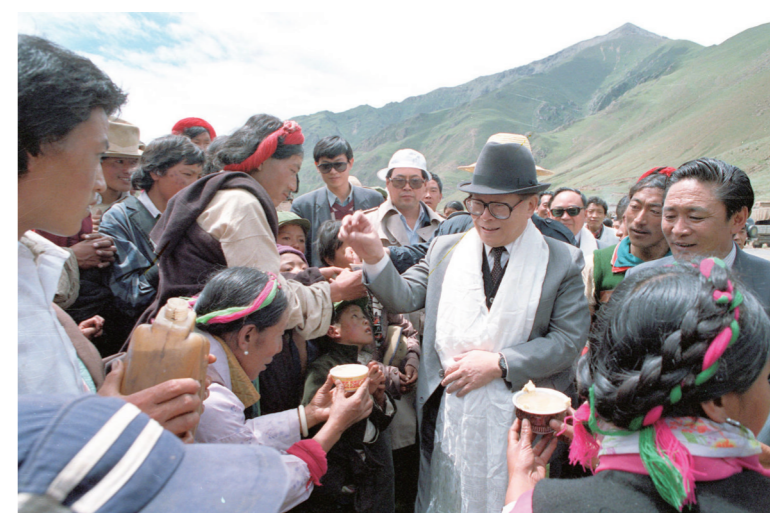
1990年7月25日，江泽民同志与藏族群众共庆望果节。