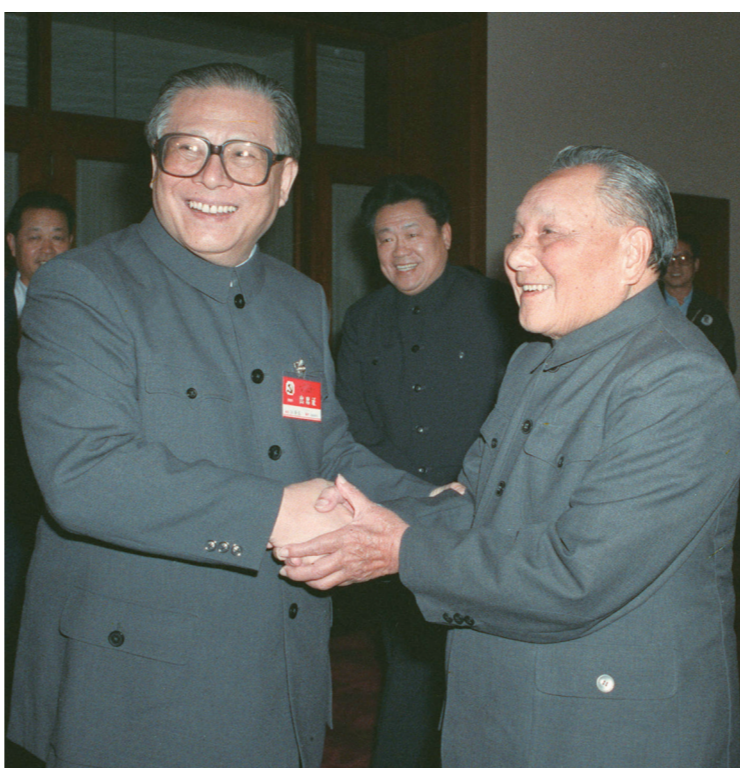
▶1989年11月6日至9日，中国共产党第十三届中央委员会第五次全体会议在北京召开。这是邓小平同志和江泽民同志亲切握手。