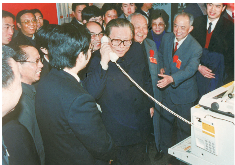
1984年5月，江泽民同志在北京展览馆举行的全国电子新产品展览会上，试用国际长途电话向远方的工作人员问候。