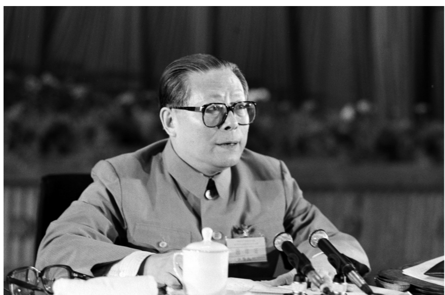
▲1989年6月23日至24日，中国共产党第十三届中央委员会第四次全体会议在北京召开。这是江泽民同志在会上讲话。