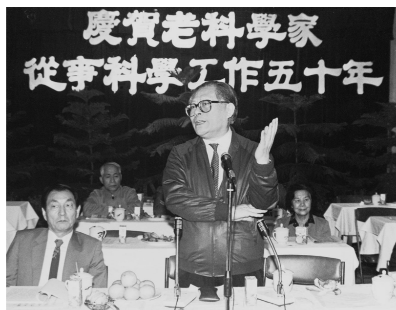
1988年10月，江泽民同志在上海庆祝老科学家从事科学工作五十年座谈会上讲话。