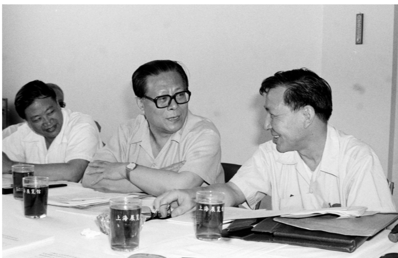
1985年，江泽民同志在上海市八届人大四次会议上。