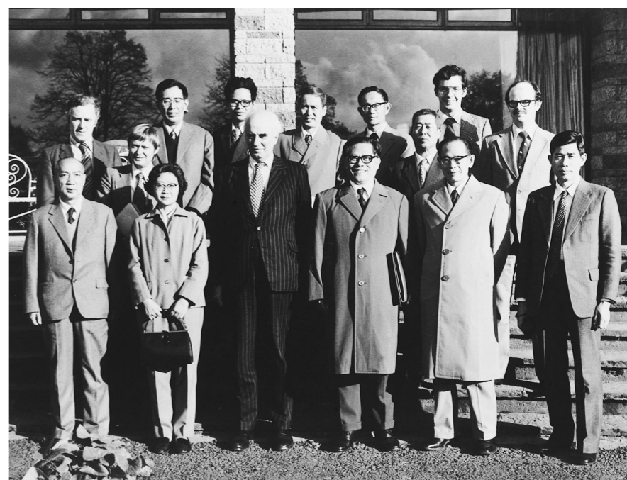
1980年10月底，江泽民同志(前排右三)在爱尔兰香农开发区考察时同开发区负责人等合影。