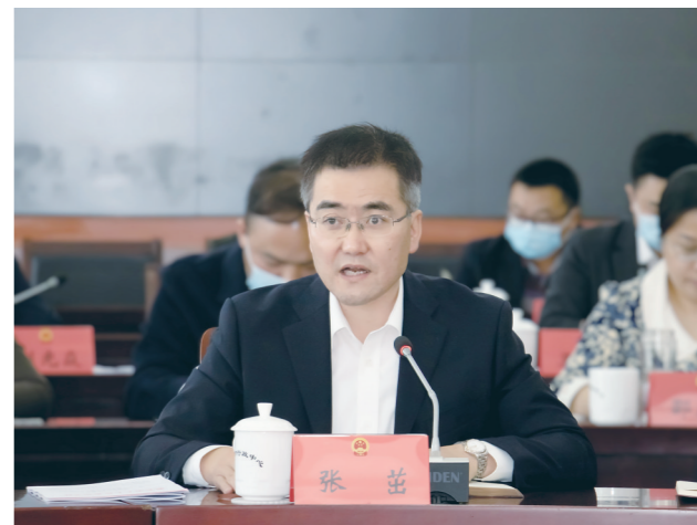
立法咨询专家代表发言