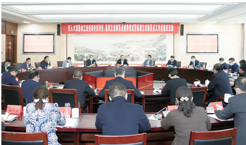
基层立法联系点工作经验交流会现场