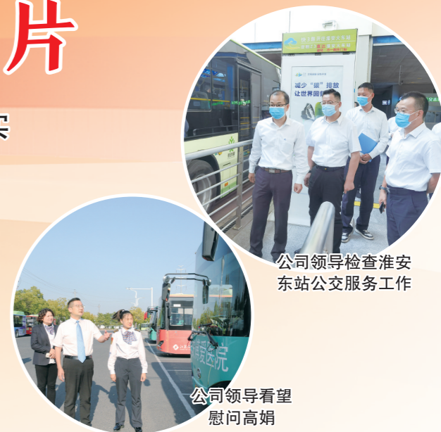
公司领导检查淮安东站公交服务工作

文化浸润让“幸福公交”更规范。 公司2019年完成制度化建设,初步建成内控体系;2020年完成规范化