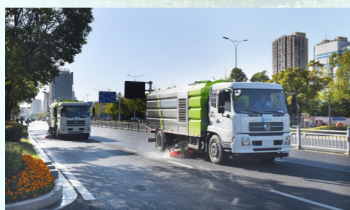
大型洗扫车在珠海路进行联合作业