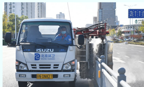
护栏清洗车在深圳路进行清洗作业