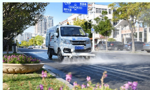
路面养护车在苏州路进行路面冲洗作业