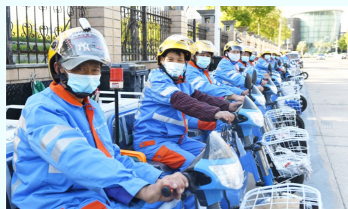
安全会后,工人整装待发