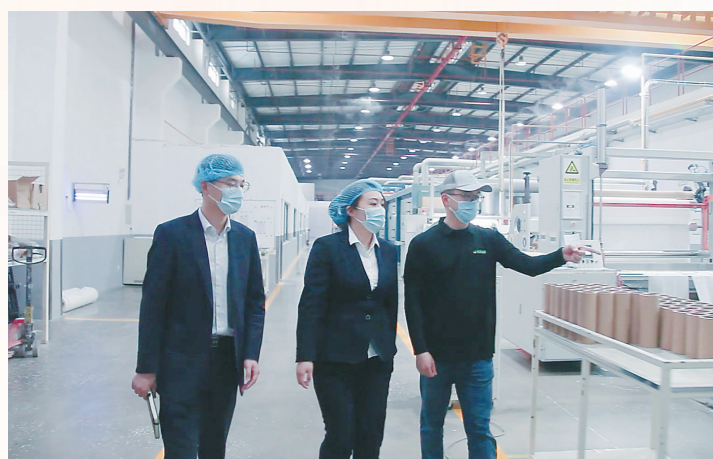
客户经理走进制造业企业现场调研