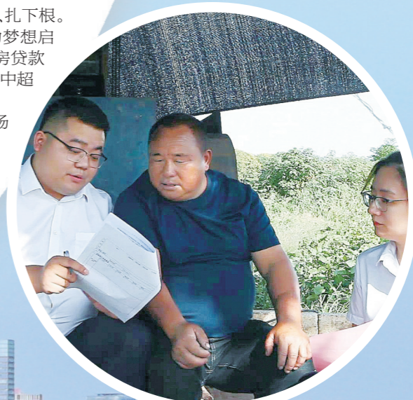
客户经理上门为退捕渔民介绍“苏渔贷”产品