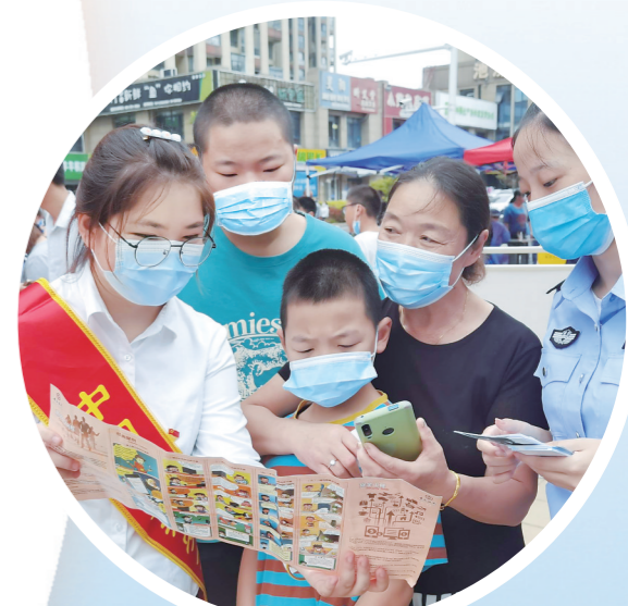
政警联动开展打击治理涉赌涉诈资金链“上门行动”宣传活动