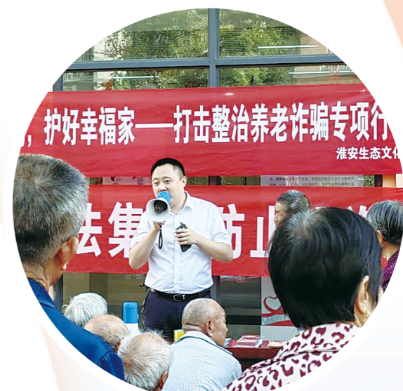
开展防范养老诈骗专项宣传活动

新起点、新征程，淮安中行踔厉奋发、笃行不殆，以更强担当、更实举措、更硬作风，在接续奋斗中创造更加辉煌的业绩，为淮安聚焦打造“绿色高地、枢纽新城”、全面建设长三角北部现代化中心城市作出更大贡献。