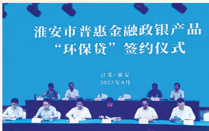
参加淮安市普惠金融政银产品“环保贷”签约仪式