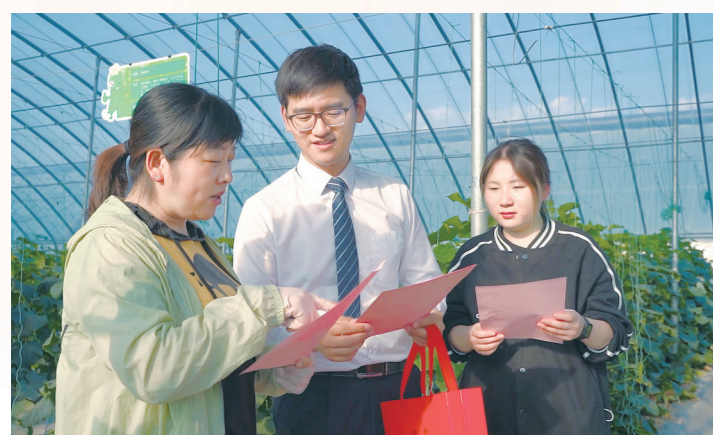
扎实开展助农工作