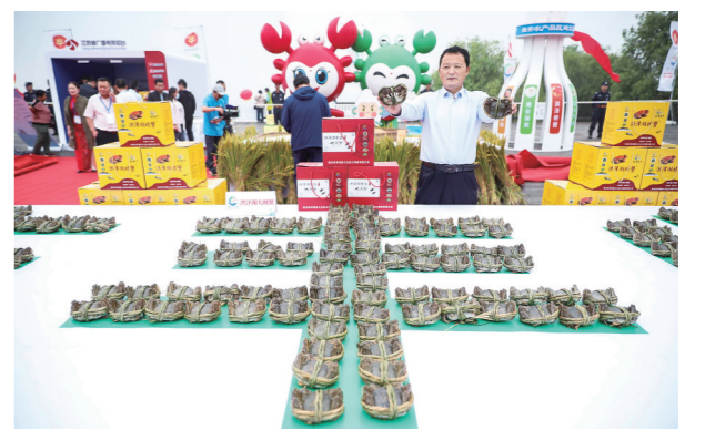
洪泽湖大闸蟹喜获丰收