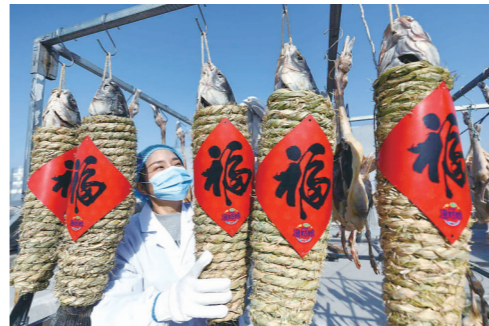
生态农产品产销两旺