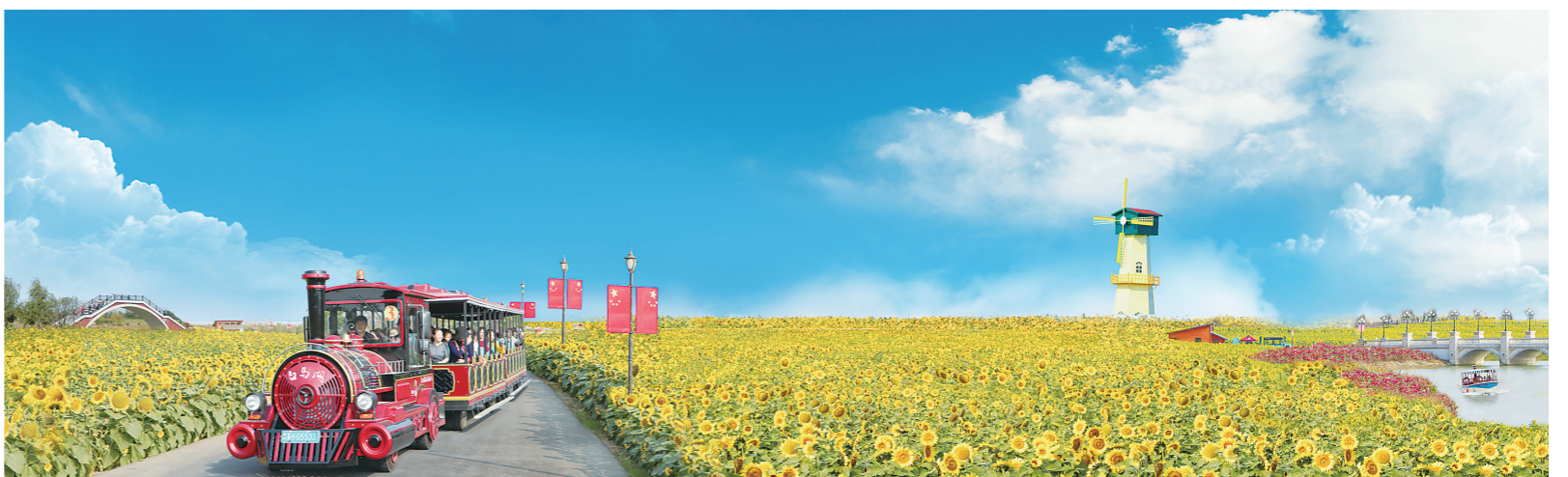
白马湖千亩向日葵盛开吸引游客打卡