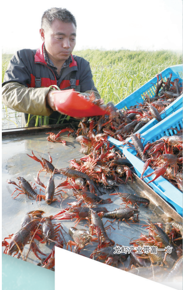
龙虾产业带富一方

下一步,全市农业农村系统将紧密围绕中央和省市委关于“三农”工作部署,怀着对农民的深厚感情、对农业的重大责任、对农村的无限关注,坚定信心、锐意进取,真抓实干、埋头苦干,奋力开创“三农”工作新局面,让农业成为有奔头的产业,让农民成为有吸引力的职业,让农村成为安居乐业的美丽家园,走出一条具有淮安特点的乡村振兴道路,打造共同富裕的“淮安样板”。