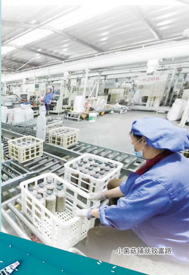
小菌菇铺就致富路