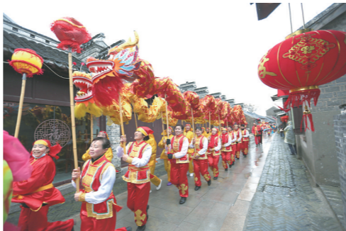
岔河老街民俗闹元宵