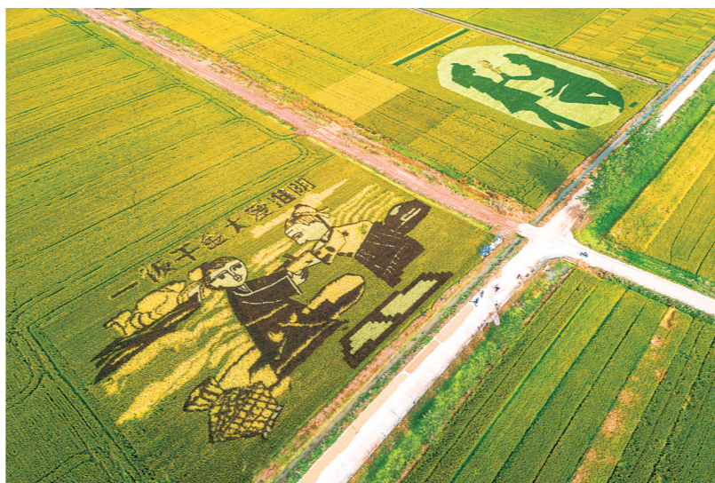
“淮安大米”优质稻米生产基地