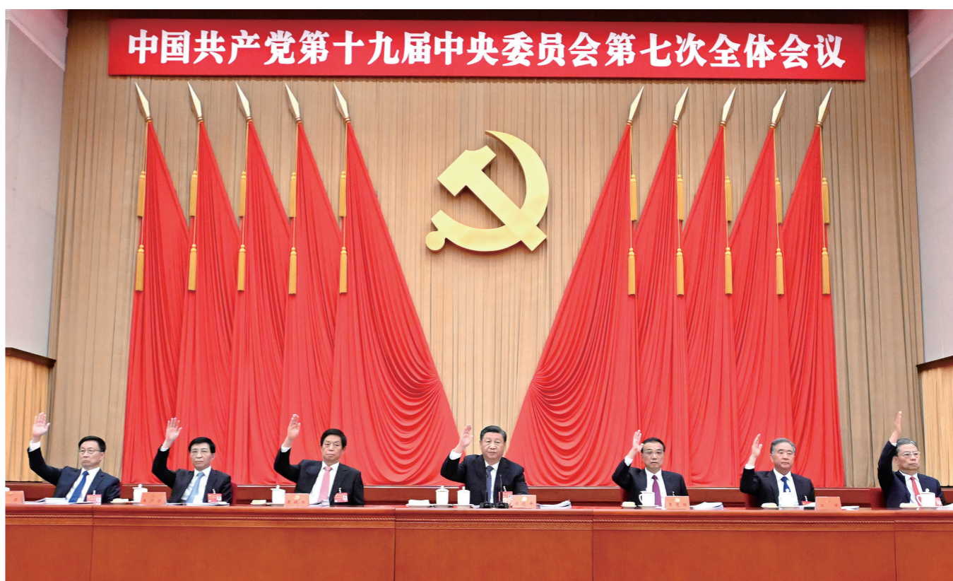
中国共产党第十九届中央委员会第七次全体会议，于2022年10月9日至12日在北京举行。这是习近平、李克强、栗战书、汪洋、王沪宁、赵乐际、韩正等在主席台上。

新华社北京10月12日电 中国共产党第十九届中央委员会第七次全体会议公报（2022年10月12日中国共产党第十九届中央委员会第七次全体会议通过）