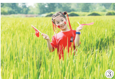
刚刚过去的中秋小长假期间，市民通过多种方式休闲娱乐，享受美好假日时光。图①：由淮安白马湖文化旅游发展有限公司、淮安日报社广告有限公司共同举办的“星空露营嘉年华”现场；图②：淮安森林公园内各色菊花盛开，市民带孩子拍照留念；图③：市民带孩子到乡村欣赏田园风光。