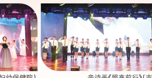
音诗画《照亮前行》(市中医院)