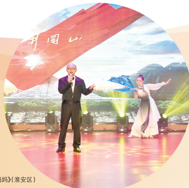
独唱《我的祖国妈妈》(淮阴区)