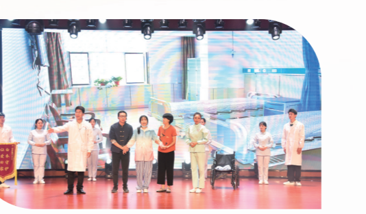
情景剧《白衣守护 让爱回家》(市四院)