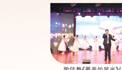
歌伴舞《最美的星光》(市妇幼保健院)