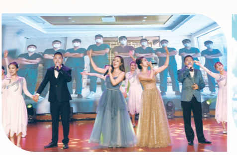
歌伴舞《一家人》(市三院)