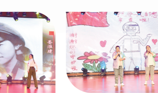
组合唱《最美的期待》(洪泽区)