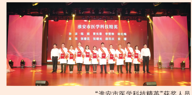
“淮安市医学科技精英”获奖人员