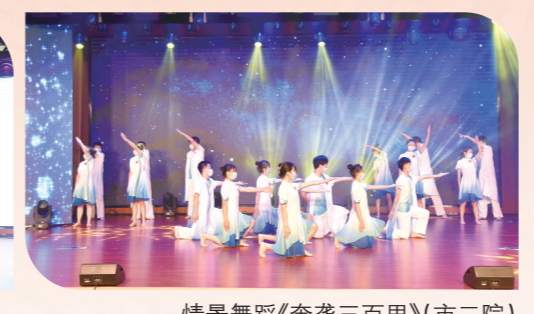
情景舞蹈《奔袭三百里》(市二院)