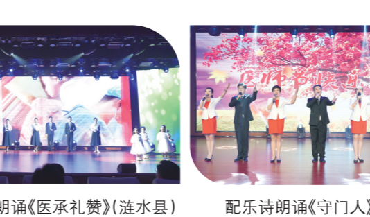
配乐诗朗诵《秉承礼赞》(涟水县)