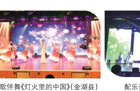
歌伴舞《灯火里的中国》(金湖县)