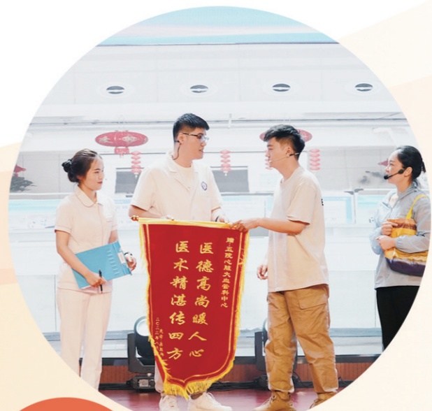
情景剧《为生命护航 为健康扬帆》(淮阴区)