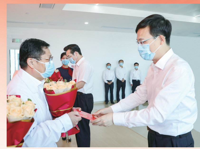
市委书记陈之常、市长史志军慰问优秀医师代表