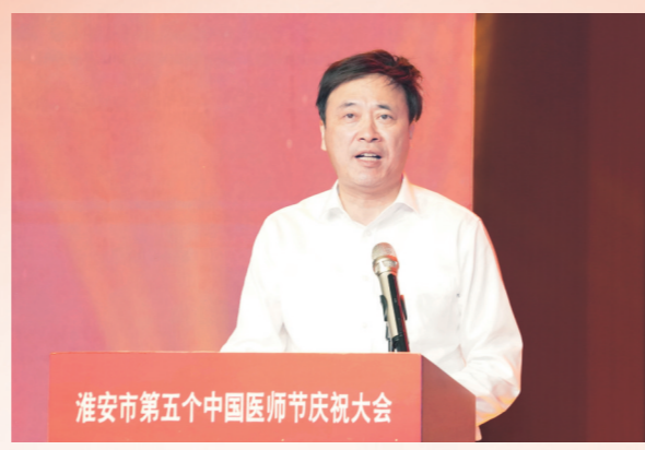
市卫健委党委书记、主任郑东辉致辞