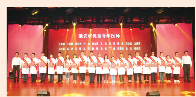
“淮安市优秀青年医师”获奖人员