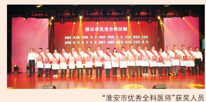
“淮安市优秀全科医师”获奖人员