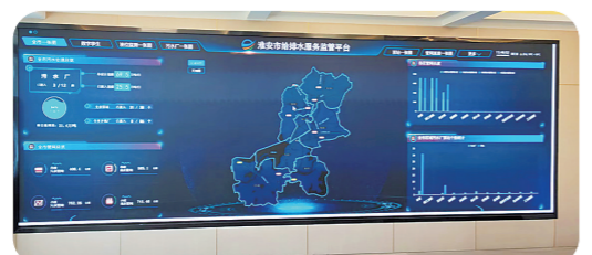
淮安市给排水服务监管平台

好口碑源自工程硬质量。据了解，市主城区控源截污PPP项目含工程建设和污水管网运营两个部分，其中建设部分涵盖集中排水户管雨污分流改造、道路市政污水管网完善、河道截污整治和GIS平台搭建四大子项，共完成310个小区雨污分流改造、48条道路市政管网完善作业、5条河道截污工程，新铺各类雨污水管道337公里，建设总容积1.91万立方米的初雨调蓄池4座、延安西路污水提升泵站一座、一体化泵站14座。工程完成对主城区132条道路约384公里雨污水管网的普查，同步完成约125条道路污水管网的病害修复。值得一提的是，工程硬件软件两手抓，建成省内领先的智慧水务GIS管理系统，实现了政府监管与企业运营的智慧化水务管理。