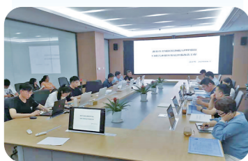
污水提升泵站升级改造设计评审会