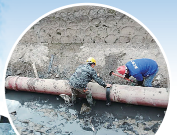
内城河铸铁管卡箍安装

“排水更通畅，城市更美好。”市给排水中心相关负责人表示，主城区控源截污PPP项目建成，提升了市民居住环境，有效解决了困扰部分老城区几十年的污水主干管不完善、不通达、排放散乱、污染水体等问题，既美化了城市的“面子”，又夯实了城市的“里子”。下一步，市给排水中心将充分利用好项目建成红利，为淮安市民全力绘就水清岸绿、人水和谐的美丽画卷。