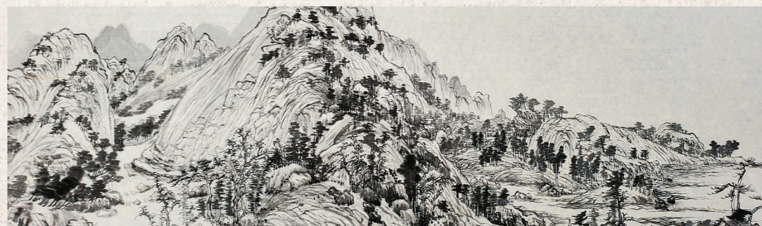
临摹《富春山居图》局部1