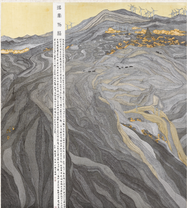
中国画《瑶寨物语》 尺寸：205×230cm