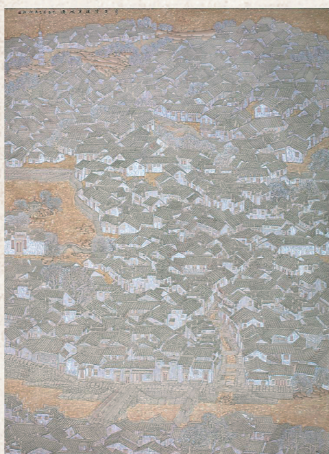
中国画《弯弯清溪穿城过》 尺寸：192×230cm