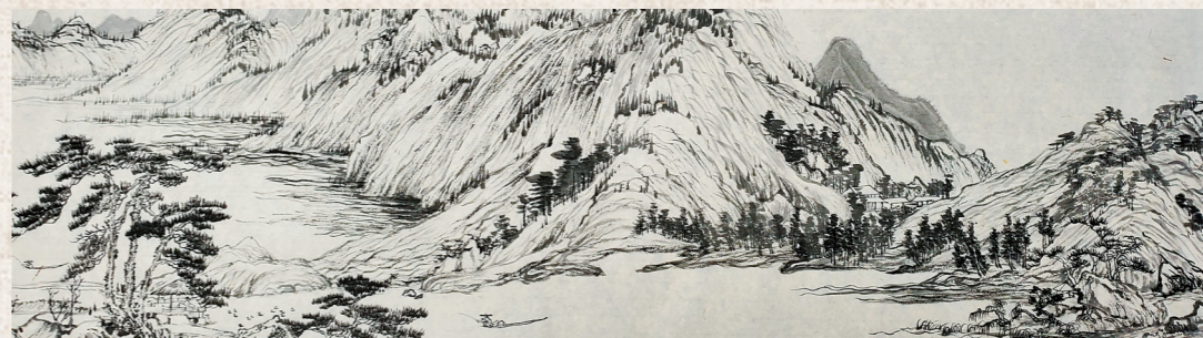
临摹《富春山居图》局部2