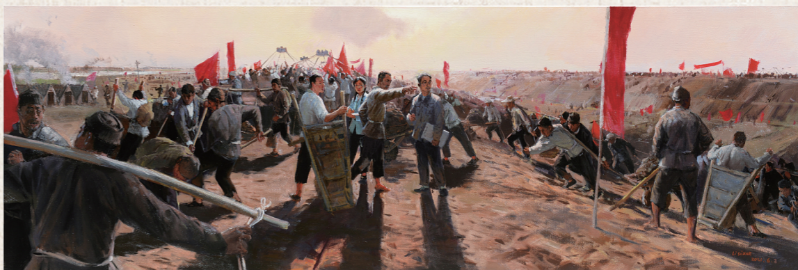
《通淮入海——苏北灌溉总渠》尺寸:70×210cm