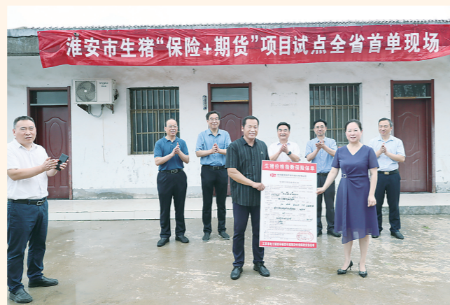
2022年6月28日,江苏省地方财政补贴型生猪期货价格保险全省首张保单由中华财险盱眙支公司出单