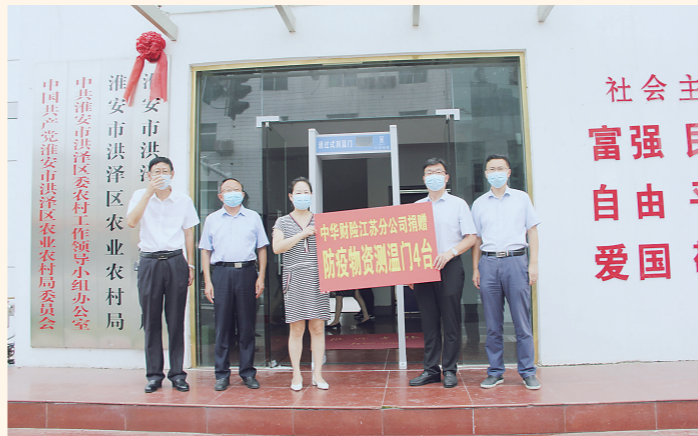
中华财险淮安中支向洪泽区政府捐赠测温门等抗疫物资,助力抗疫工作