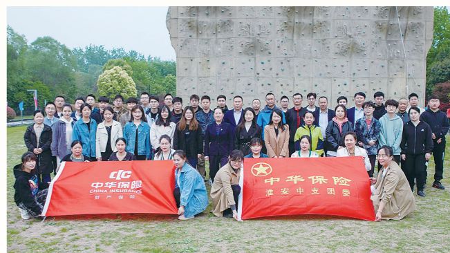
中华财险淮安中支开展“携手共超越、一起向未来”五四青年节主题团建活动

截至2021年12月31日,该公司年度全险种保费收入4.13亿元,同比增长14.33%,位列全市同行业前三。在保费总收入中,农险保费收入2.43亿元,同比增长17.01%,稳居全市行业第一。