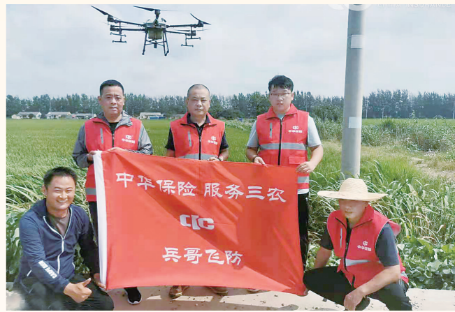
中华财险淮安中支无偿为部分种植大户提供无人机药洒服务