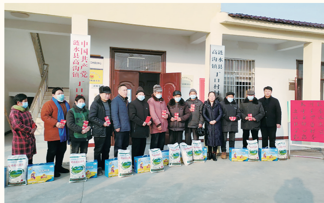
中华财险淮安中支赴涟水县高沟镇丁口村走访慰问

据介绍,经过多年的培养和磨炼,中华财险淮安中支打造了一支1300余人的农险经营专业团队,具体落实展业、核保、出单、查勘、核赔、定损、财务、统计、档案等工作。全辖内勤、外勤、法务协调配合,业务娴熟、技能精湛、操作规范,保证了从承保到理赔的高效快捷服务。值得一提的是,目前,中华财险淮安中支是唯一一家在全市建立了县(区)有机构、镇(街道)有服务站、村有服务点、镇村有专兼职农险协保员的农业保险服务网络体系的保险机构,为宣传政府惠农政策、提供便民服务、打通“三农”服务“最后一公里”、实现我市农业保险高质量发展提供了有力保障。