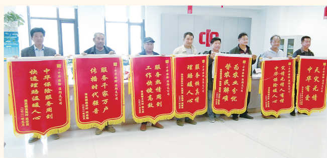
受灾农户送来锦旗,感谢中华财险淮安中支快速应对灾情,为他们赢得了尽快恢复生产的宝贵时间

此外,中华财险淮安中支坚持科技创新,种植业卫星遥感精准承保理赔技术、养殖业保户联动及“兴农保”APP等线上平台的应用,进一步提高了工作质效、缩短了理赔周期,确保承保理赔流程更加规范、科学、准确,赢得了政府和百姓的赞誉。还先后落地了商业性生猪价格指数保险、商业性鸡蛋价格指数保险等“保险+期货”类产品,小龙虾完全成本保险、内塘螃蟹水文指数保险、商业性母猪补充保险等创新产品,为农民增收、农业增产、农村稳定奠定了基础。