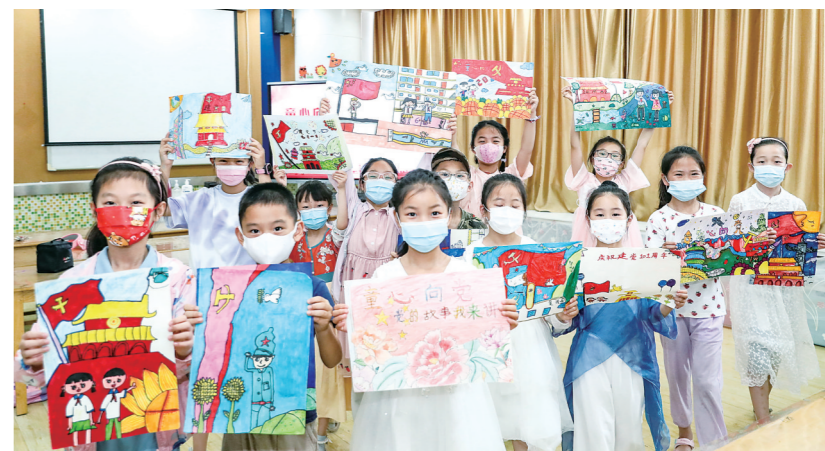
6月29日，市妇女儿童活动中心开展“童心向党迎七一”主题绘画活动，小朋友通过绘画作品，表达对中国共产党美好祝福。