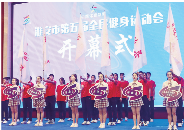
市第五届全民健身运动会开幕式现场