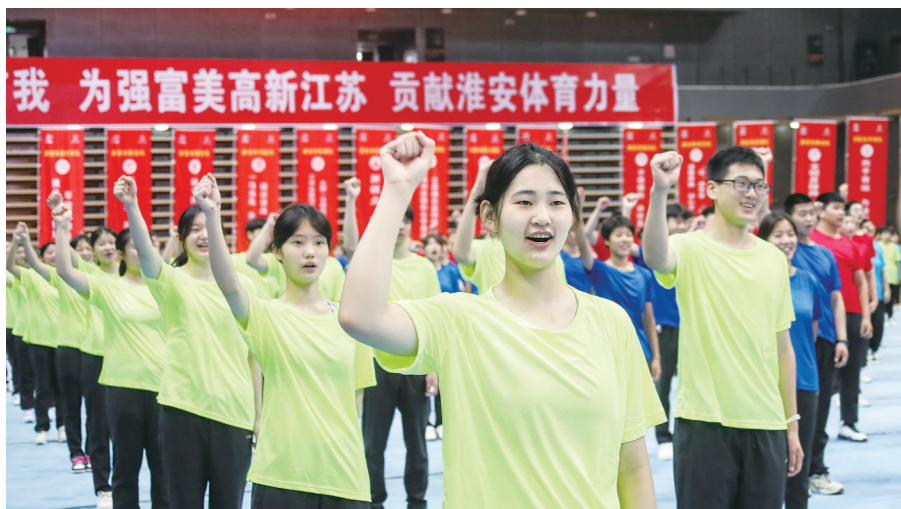
省第二十届运动会淮安市体育代表团出征仪式现场