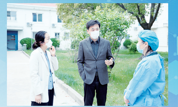
市卫健委主任郑东辉在市二院厦门路院区督查疫情防控工作。