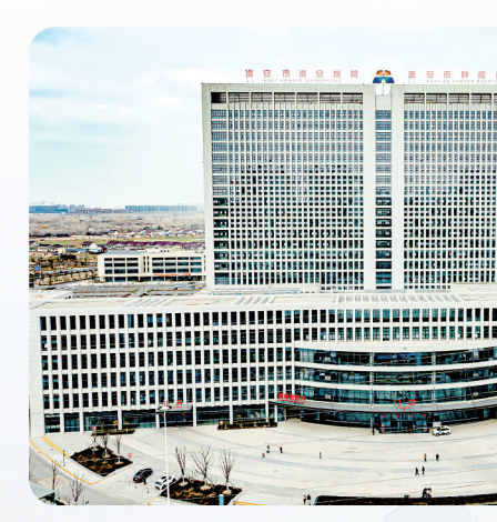
淮安区淮安医院新院总投资近14亿元，总建筑面积21万平方米，已全面投入使用。

【记者观察】全市卫生健康系统用情护佑人民健康，以优质服务提升获得感。促进3岁以下婴幼儿照护服务健康发展，建立联席会议制度、市级专家库和婴幼儿早期照护指导中心。计生特殊家庭“三项制度”实现全覆盖。3个社区被命名为“全国示范性老年友好型社区”。