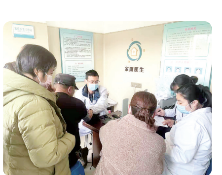
清江浦区积极开展家庭医生访谈。

【数说】顺利通过第四次国家卫生城市复审，新创国家卫生镇4个、省卫生镇3个、省卫生村191个，省健康镇3个、健康村(社区)41个，新创15家省健康企业，总数位居全省前列。