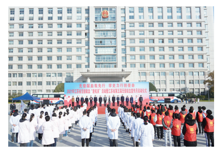
无偿献血我先行，学史力行担使命。江苏省第五届无偿献血宣传月活动启动仪式在淮安举行。

引领开新局。举办“永远跟党走 开启新征程”党史知识竞赛、“在党旗引领下成长”征文比赛等活动，开展“两在两同”建新功行动，全系统党员干部理想信念更加坚定、宗旨意识更加牢固、责任担当更加强烈。