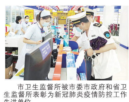
市卫生监督所被市委市政府和省卫生监督所表彰为新冠肺炎疫情防控先进工作单位。