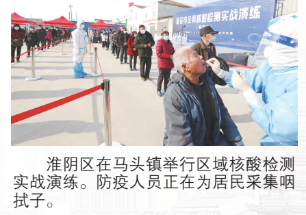
淮阴区在马头镇举行区域核酸检测实战演练。防疫人员正在为居民采集咽拭子。

专班、核酸检测专班，有效落实例会、信息报送、应急值守制度。切实抓好入境人员和高风险地区来淮返淮重点人员管控，对进口物品及外环境“逢进必检”“定期抽检”。