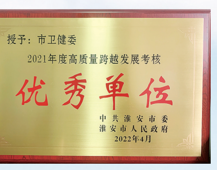
市卫健委荣获2021年度全市高质量发展考核“先进单位”称号。