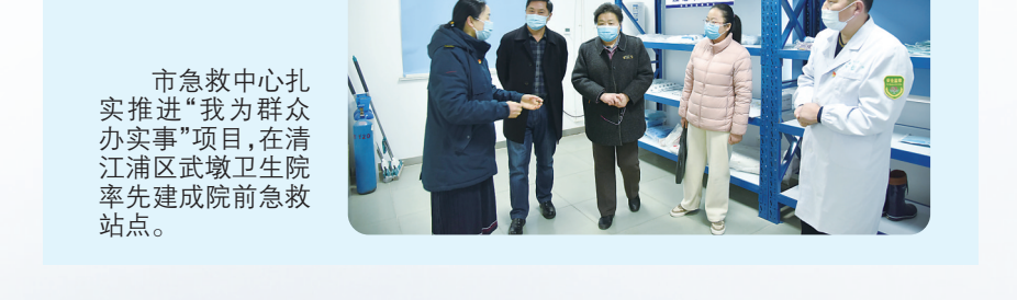
市急救中心扎实推进“我为群众办实事”项目，在清江浦区武警医院率先建成院前急救站点。

【记者观察】全市卫生健康系统蹄疾步稳深化综合医改，以抓落实推动快发展。推动公立医院精细化管理，印发《进一步深化分级诊疗推进优质资源下沉的实施方案》，推进国家区域点数法总额预算和病种分值付费试点工作。