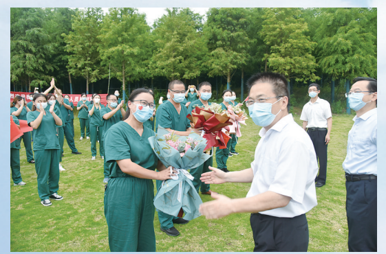
市卫健委党委书记孙邦贵将鲜花赠予援宁援沪抗疫勇士。