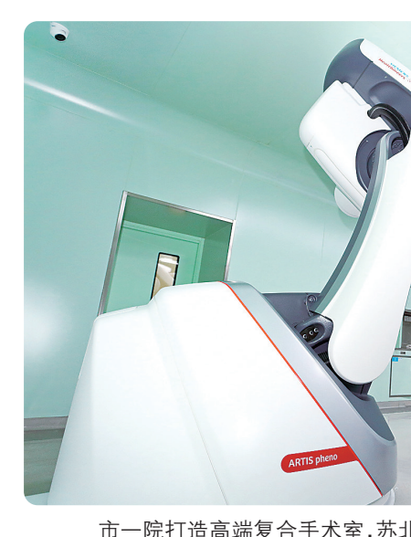
市一院打造高端复合手术室，苏北首台血管造影机“飞龙”落户市一院，为众多患者带来福音。