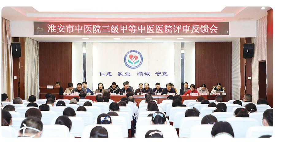
市中医院通过三级中医院新一轮周期评审，自2013年成功创建三级甲等中医院后，再次获评“三甲”。

【记者观察】过去的一年，全市卫生健康系统务实创新建设“健康淮安”，以新作为开创新局面。完成《淮安“十四五”卫生健康发展规划》编制工作，组织实施“十大工程”，努力打造“科学卫健、和谐卫健、智慧卫健、共享卫健”。