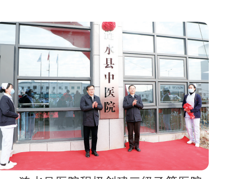
涟水县医院积极创建三级乙等医院，县中医院新院建成投用，卫生健康服务体系不断完善。

【记者观察】过去的一年，全市卫生健康系统务实创新建设“健康淮安”，以新作为开创新局面。完成《淮安“十四五”卫生健康发展规划》编制工作，组织实施“十大工程”，努力打造“科学卫健、和谐卫健、智慧卫健、共享卫健”。