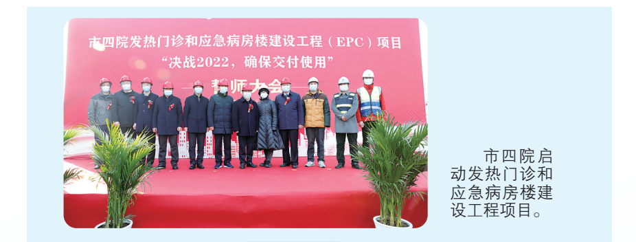
市四院启动发热门诊和应急病房楼建设工程项目。

【数说】在国家三级公立医院绩效考核中，市一院位列全国一百二十四、全省第五，市四院位列(无手术组)全国第三、全省第一。新增达到国家“推荐标准”的基层医疗卫生机构17个，新建省级农村区域性医疗卫生中心6个、社区医院4个、甲级村卫生室18个，新创省基层特色专科9个，新补充农村基层卫生人员780人。