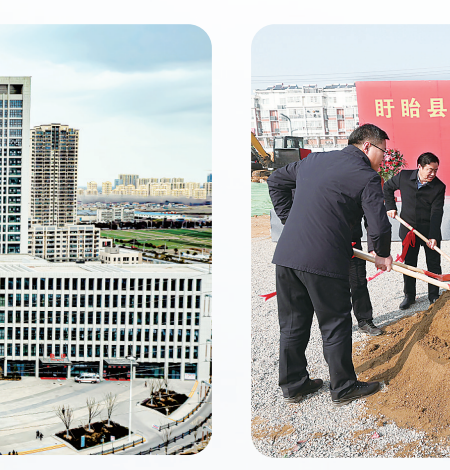
盱眙县公共卫生服务中心举行奠基仪式。

疫情防控还在继续，“健康淮安”任重道远。市第八次党代会确立了聚焦打造“绿色高地、枢纽新城”，全面建设长三角北部现代化中心城市的奋斗目标，中心城市复兴梦想已经启航，复兴的征程上离不开“健康淮安”板块，需要全体卫生健康人踔厉奋发、笃行不怠。对此，全市卫生健康系统满怀信心、充满期待。