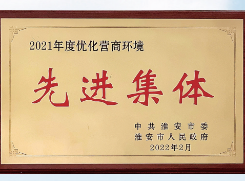
市卫健委被市委市政府表彰为2021年度优化营商环境先进集体。