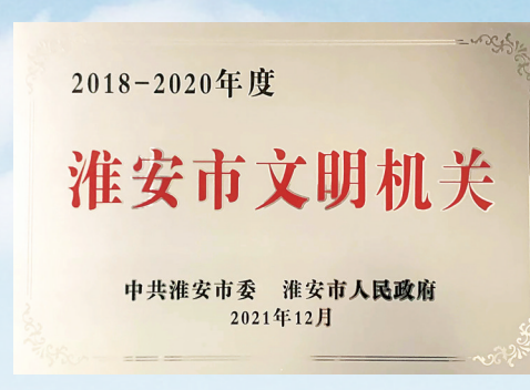
市卫健委获得2018—2020年度市文明机关称号。