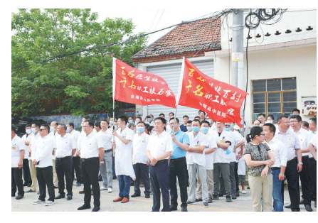
金湖县卫健系统开展“百医联百村”惠民行动，推动医疗卫生工作重心下移。

【数说】深入开展党史学习教育，按照“学党史、悟思想、办实事、开新局”要求，组织开展中心组学习、专题学习研讨、专家辅导授课、走进红色实践课堂等活动200余次。