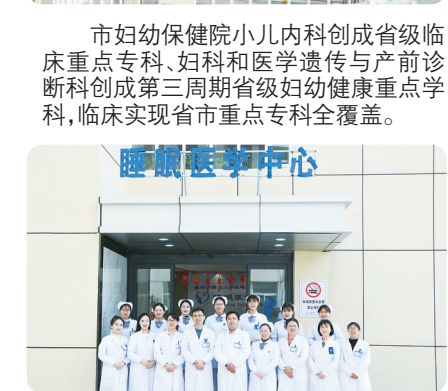
市妇幼保健院小内儿科创成省级临床重点专科。妇科和医学遗传与产前诊断科创成第三周期省级妇幼健康重点学科，临床实现省市重点专科全覆盖。

【记者观察】全市卫生健康系统凝心聚力打造医疗高地，以强内涵实现上水平。市妇幼保健院获批中国康复医学会儿童康复专委会培训基地。市三院全面托管市新安医院，形成“一院两区”的新发展格局。