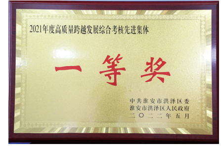
洪泽区卫健委统筹疫情防控和经济发展，被区委区政府授予综合考核先进集体一等奖。

【数说】全年检测物样本8.96万份，全年完成47类重点人群核酸检测552.01万人次，累计抽调3000余名医务人员支援外地，3-11岁儿童首剂接种率全省第三，60岁以上人群首剂接种率全省第二。