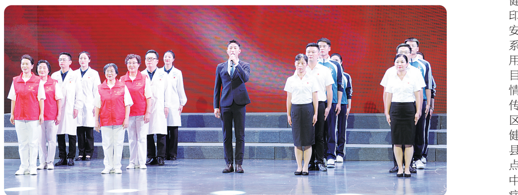
党史学习教育文艺汇演《我是共产党员，祖国不会忘记》演出场景。