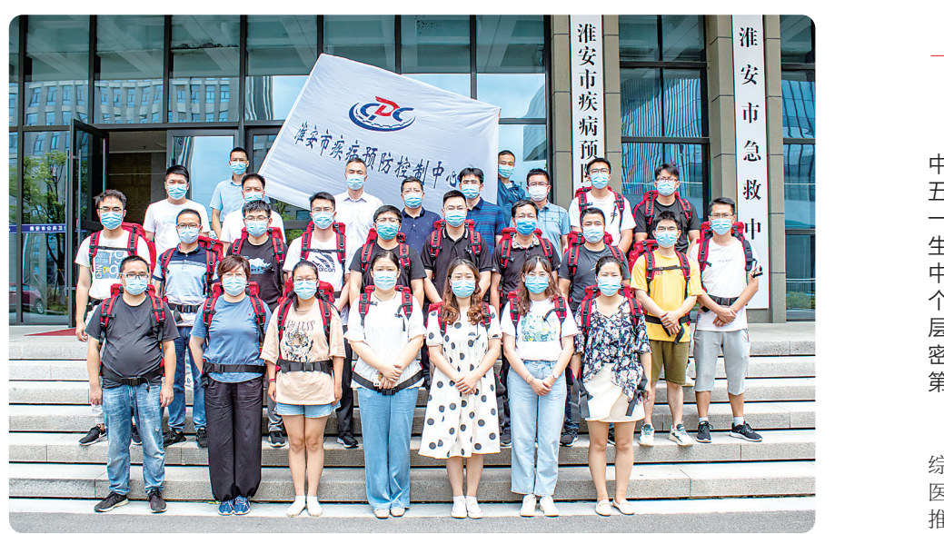
淮宁一家亲——市疾控中心第一批流调队员驰援南京。