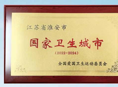
我市顺利通过国家卫生城市复审。