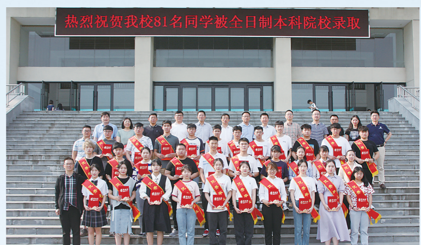
2021年,81名同学被全日制本科院校录取