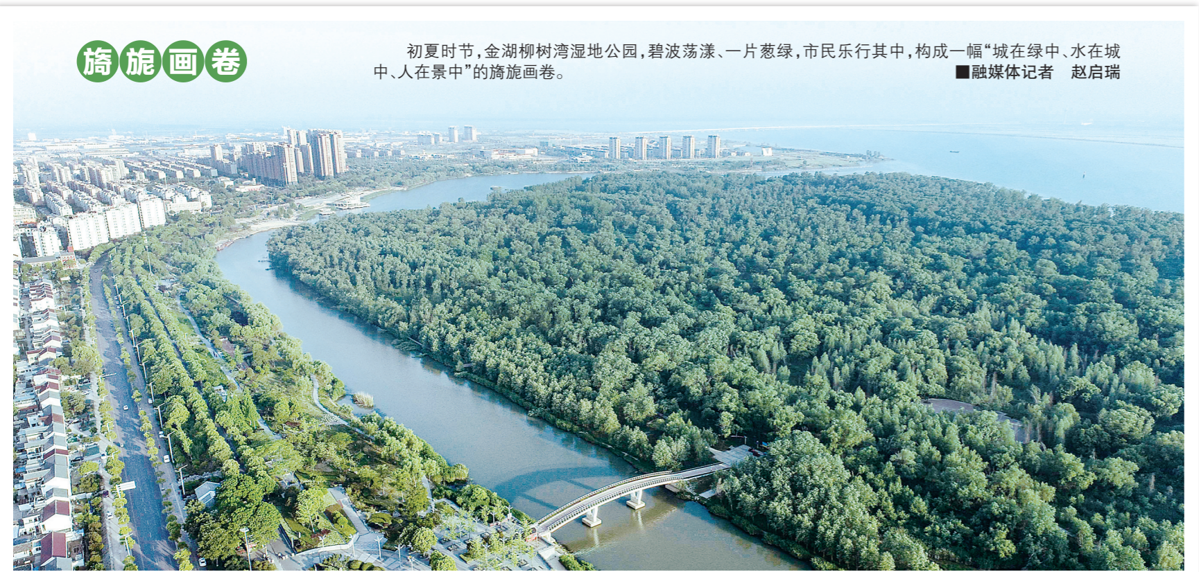
初夏时节,金湖柳湾湿地公园,碧波荡漾、一片葱绿,市民乐行其中,构成一幅“城在绿中、水在城中、人在景中”的旖旎画卷。