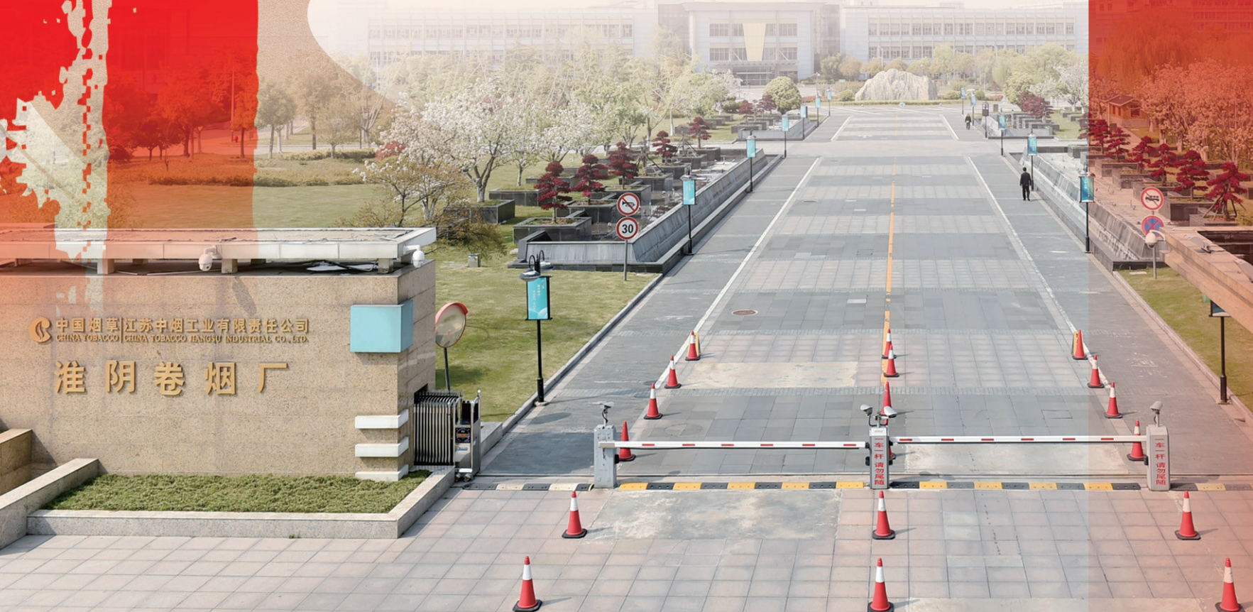
中国烟草江苏中烟工业有限公司 HUAIYIN CIGARETTE FACTORY 淮阴卷烟厂