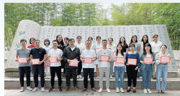
青年教师基本功大赛教师合影