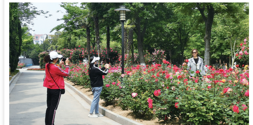
“五一”假期，月季园花开正盛，部分市民入园踏青赏花，但个别市民在花丛中随意踩踏，拉着花拍照很不文明。