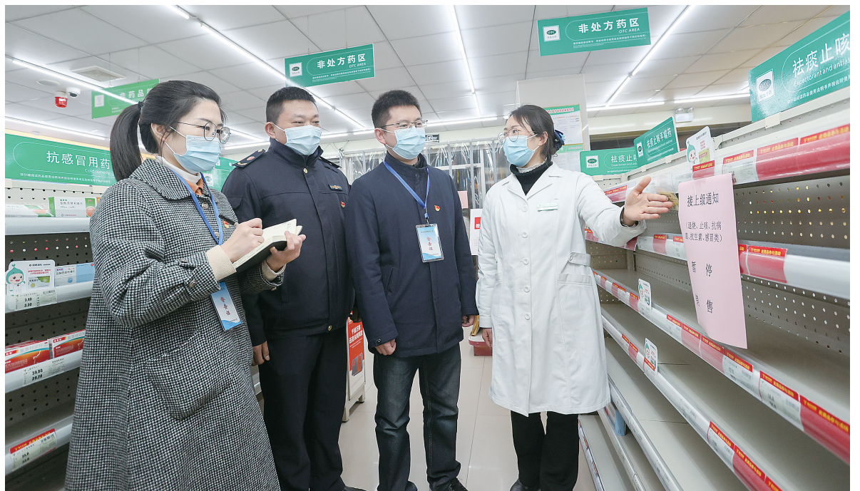
3月22日晚,市纪委监委联合市市场监督管理局等部门走进市区药店,检查“四类药品”管控、进店人员信息登记等工作,督促药店落实各项疫情防控措施。

记者注意到,除了暂停销售“四类药品”,各大药店的各类防疫物资储备相对充足。清江浦区一家药房的店员说:“近期疫情防控形势严峻