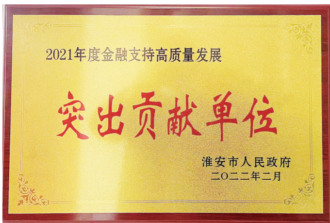
淮安国寿获评“2021年度金融支持高质量发展突出贡献单位”