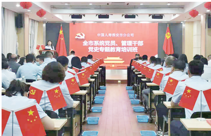
淮安国寿举办党史专题教育培训