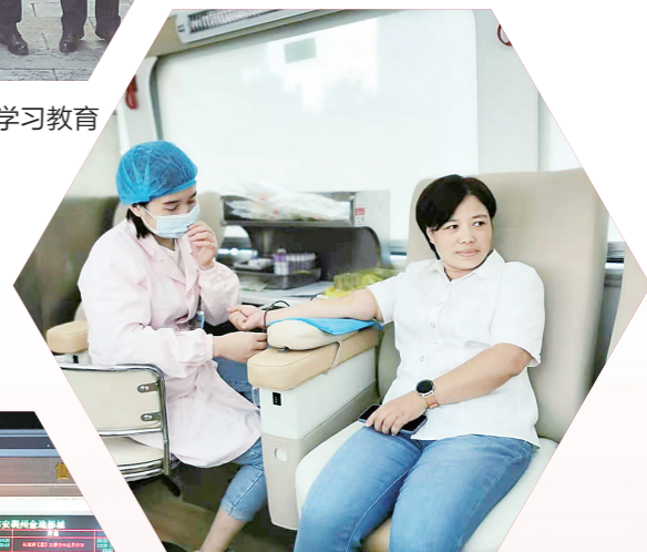
淮安国寿员工参加无偿献血