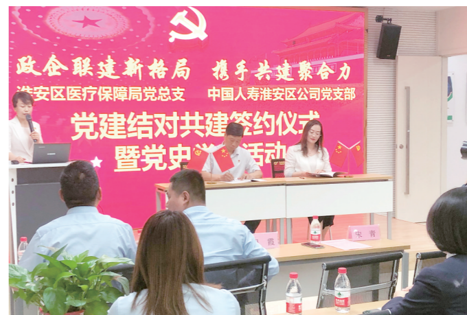
中国人寿淮安分公司与淮安医保局党建结对共建签约仪式