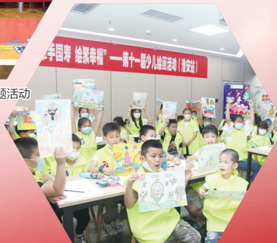
“牵手国寿 绘聚幸福”主题活动