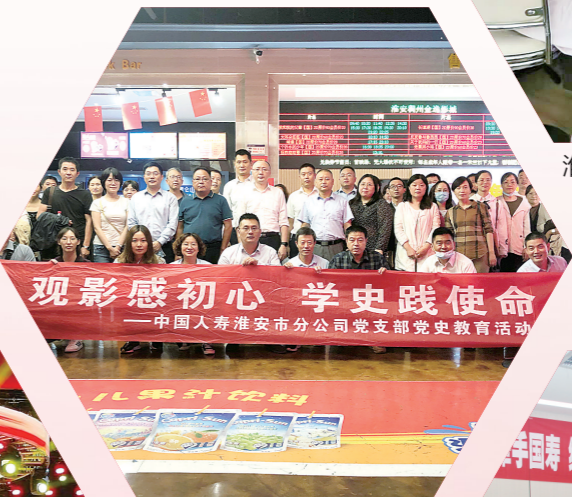
“观影感初心 学史践使命”主题活动