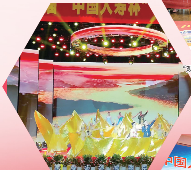
“中国人寿杯”老年春晚

淮安国寿秉持“成己为人,成人达己”的企业文化核心理念,积极履行社会责任。多年来,公司在文化、体育、教育等多领域投入资金和资源,支持地方群众体育与文化发展。“中国人寿杯”老年春晚已连续举办十年,十年间累计投入近300万元,已经成为淮安老年文艺活动的品牌活动和盛事。下一步,淮安国寿将加快自身发展,加大民生服务与乡村振兴投入,提供更加优质多元的保险服务和保险产品,以“国寿温度”助推区域经济发展迈向新高度。