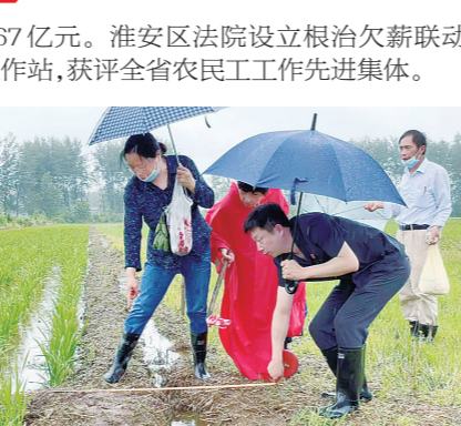
法官现场丈量存在争议的土地

1072名干警与低收入家庭结对帮扶。出台人民法院助力乡村振兴“二十四条意见”,开展“一法庭一品牌”创建活动,省法院主要领导予以批示肯定。省法院在涟水县法院挂牌成立苏北首家服务乡村振兴实践基地,淮安地区挂牌基地数量占全省总数的1/4。洪泽法院“旅游法庭”、金湖法院“五好法庭”建设经验被省法院推广。规范和引导新型农业经营主体发展,一审审结涉家庭农场、农民专业合作社案件371件。支持农村土地制度改革,一审审结涉农地“三权分置”案件677件。妥善解决农民工“忧薪断薪事”,为1.75万名农民工追回“血汗钱”