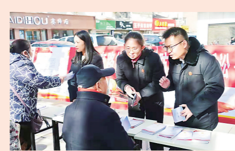
组织干警开展“套路贷”法治宣传活动

严惩口蜜腹剑、隐瞒行程等扰乱抗疫情秩序行为,一审审结涉疫情犯罪案件33件。850余名干警下沉一线,妥善化解因疫情引发的纠纷650件,帮助348家企业稳岗复产。防控金融风险,推动解决融资难融资贵问题,一审审结金融纠纷案件15803件。防范打击非法金融活动,一审审结非法集资等犯罪案件117件,向公安机关移送“套路贷”线索2045条。防控房地产领域风险,坚持“房住不炒”定位,一审审结房屋买卖合同纠纷案件17275件。协助处置55个“问题楼盘”,经区政府联动推进“淮海青年城”复工续建,实现交房、办证、清债“三个百分百”。联合市住建局开展建设工程领域转包、违法分包专项整治,向住建局移送问题线索64条。防控安全生产领域风险,一审审结重大责任事故犯罪等案件113件。