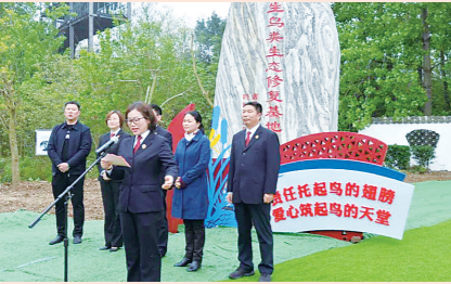
设立全省首个野生鸟类生态修复基地

市法院获评全省金融生态县创建工作先进单位,连续两年被授予全国查处侵权盗版案件有功单位,连续三年被评为全市优化营商环境工作先进集体。联合市工商联开展的“啄木鸟”法律体检活动获评全国工商联法律服务创新案例。建成全省首个涉台纠纷调处中心,设立全省首个野生鸟类生态修复基地,建立全国首个凹土协同保护机制。