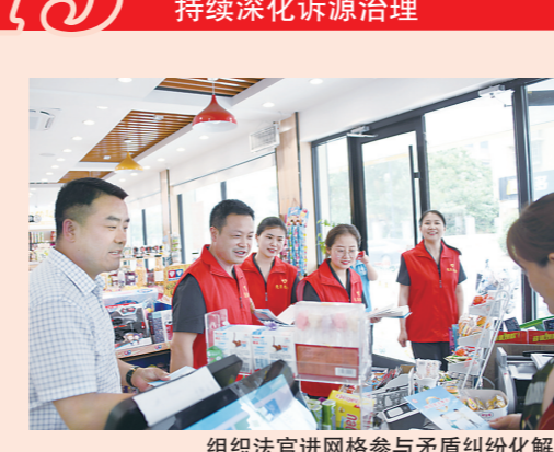
组织法官进网格参与矛盾纠纷化解

加强诉前调解工作,诉前调解成功率位居全省第一。建成道交、物业、金融、破产等类型化诉调对接平台,市法院联合市工商联编制的《商会商事调解工作手册》作为范本在全省推广。全市法官进网格参与化解纠纷2.57万起,发出司法建议书1317件。以“无讼淮安”创建为引领,打造社会治理特色品牌,洪泽法院“无讼村居”建设经验在全国法院“枫桥经验”研讨会上交流;淮阴法院首创“五共五强”法治示范村,推动构建乡村善治格局;金湖法院深耕“全域调解”机制,民事案件结案数量连续四年下降。