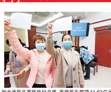
加大涉民生案件执行力度,发放民生款项41.62亿元

执结案件189562件,执行到位标的额303.50亿元,2021年执行完毕率、实际执行到位率居全省第一。切实强化执行措施,开展集中或专项执行2276次,拘留2461人,以涉嫌拒不执行移送侦查159人。加大拖欠企业账款和涉民生案件执行力度,兑现企业债权82.47亿元,发放民生款项41.62亿元。强化跨空架制管公司、某养殖公司等场地,为大运河百里画廊、华强方特等重大项目建设扫除障碍。构建综合治理执行难大格局,与全市27家单位完善联动协作机制。强化失信惩戒和守信激励,发布失信被执行人信息13.22万人次,将已履行义务的4.82万人从“黑名单”中移出。创新执行工作方式,经开法院在全省率先推行继续履行责任保险,市法院在全省率先发出涉嫌拒不履行判决书。深化执行规范化建设,对重要流程节点实行标准化指引。