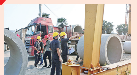
护航百里画廊项目建设 产143.53亿元,盘活土地房产919.95万平方米,安置职工30988人。

在全省率先对标世界银行评价标准,开展营商环境指标优化行动,2021年淮安地区“执行合同”“办理破产”指标均居全省第三。一审审结商事案件56072件,标的总额565.62亿元。维护市场公平竞争秩序,审结我省第一起涉及平台“二选一”不正当竞争民事案件,入选2021年度全省法院十大典型案例。建立破产审判“1+10”制度体系,强化府院协同联动,在全国首创破产财产处置信息发布机制,架起“破中取金”的信息桥梁。共帮助26家企业重整再生,引导716家企业清算退出,释放沉淀资