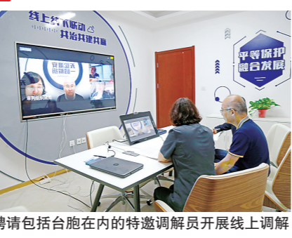
聘请包括台胞在内的特邀调解员开展线上调解

助力打造“双循环”重要枢纽节点,妥善化解高铁新区、城市快速路、京沪高速扩容等重点工程建设引发的纠纷910件。支持台资集聚示范区建设,联合市台办落实助推台商台企发展的“十六举措”,建立涉台一审商事案件集中管辖机制,一审审结此类案件436件。聘请包括台胞在内的特邀调解员开展线上调解,联动化解涉台纠纷320件。