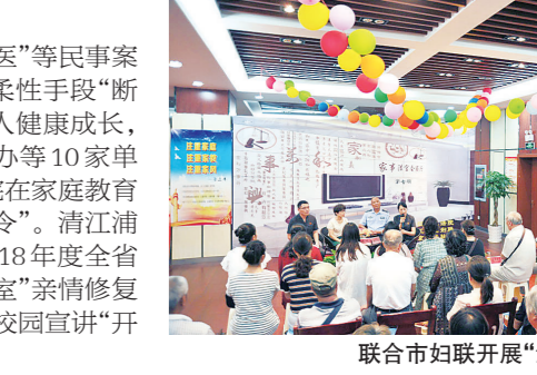
联合妇联开展“法护家园”活动

准确贯彻实施民法典,一审审结“衣食住行、业教保医”等民事案件161483件。联合市妇联开展“法护家园”活动,运用柔性手段“断家务事”,化解婚姻家庭纠纷41960件。呵护未成年人健康成长,两级法院全部设立少年审判机构。市法院联合市法官办等10家单位举办中等职业院校在校生模拟法庭大赛,暨县法院在家庭教育促进法施行当日发出全国首份“责令接受家庭教育指导令”。清江浦法院发出全省首份“家庭暴力禁止令”,入选2015-2018年度全省未成年人保护十大事件。淮阴法院构建“一中心多站室”亲情修复网络,创成全国青少年维权岗。淮安法院连续七年进校园宣讲“开学第一课”,在淮安小学设立“法护苗圃”司法保护基地。