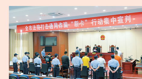
严厉打击“两卡”犯罪活动

坚持惩防结合、宽严相济,一审审结刑事案件16396件23390人。把维护政治安全放在首位,一审审结涉邪教组织犯罪案件63件。严惩影响群众安全感犯罪,一审审结“杀抢抢”犯罪案件173件,对“6·6”重大暴力袭警案的2名被告人依法判处死刑。守护百姓餐桌和用药安全,一审审结危害食品药品安全犯罪案件245件。积极参与“断卡”行动,一审审结“两卡”犯罪案件250件,挽回群众损失10.83亿元。参办“10·30”特大跨境电信网络诈骗案,对13件案件204名被告人予以严惩。编发“杀猪盘”、兼职刷单等十类陷阱提示“口袋书”,增强全民“反诈”意识。