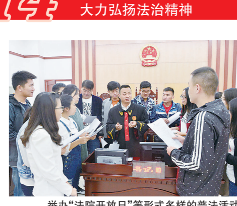
举办“法院开放日”等形式多样的普法活动

审结“全国首例英烈保护民事公益诉讼案”,引领尊崇英雄的时代风尚,被写入最高法院工作报告;审结“开具‘大小处方’套取医保资金案”,彰显严惩骗保的鲜明立场,被最高法院作为典型案例发布;审结“虚构劳动关系侵害民营企业资产案”,决不姑违法失信者“钻空子”,入选全省法院审判监督十大典型案例。坚持以案释法,将案件庭审打造成“普法公开课”,将法律文书打造成“普法宣传册”,累计网络直播庭审21.78万场,公开裁判文书32.99万份,在央视播出案例202个,拍摄微电影微视频212部,9部获最高法院表彰。清江浦区法院巡回审判“六进”获评全省首批优秀法治示范项目。