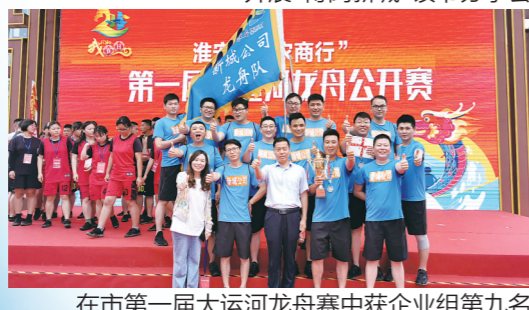
在市第一届大运河龙舟赛中获企业组第九名