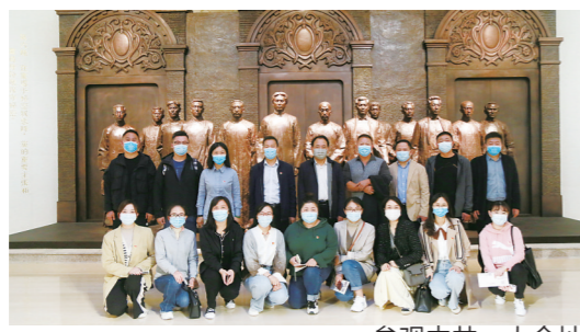
参观中共一大会址

文明之花，经久不衰。百舸争流，奋楫者先。1月14日，淮安新城投资开发有限公司被表彰为2019-2021年度江苏省文明单位。近年来，淮安新城投资开发有限公司(以下简称“新城公司”)将精神文明建设与业务工作深度融合，聚焦主责主业，以“打造宜居宜业、令人向往的生态城市，让城市生活更美好”为使命，先后完成了淮安市行政、体育、文化“三大中心”和城内学校、道路、绿化等基础设施建设任务，积极推进、深化拓展群众性精神文明创建活动，扎实开展疫情防控和“两在两同”建新功行动，加快构筑道德风尚建设高地，促进公司精神文明建设创新发展，为凝聚城市精神、传递城市文化注入坚强的思想保证和强大的精神动力。