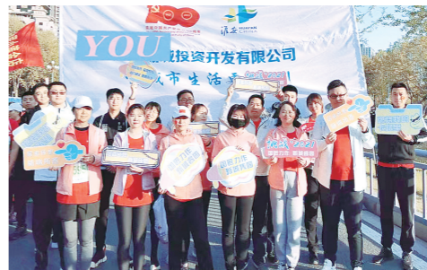
公司运动健儿参加淮安迷你马拉松