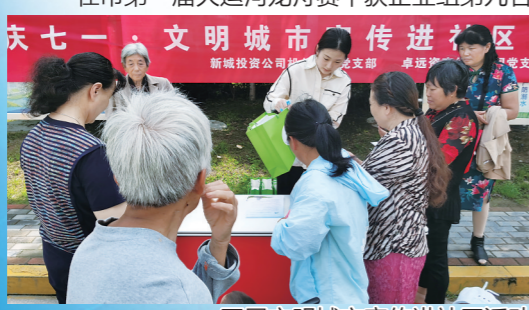
开展文明城市宣传进社区活动