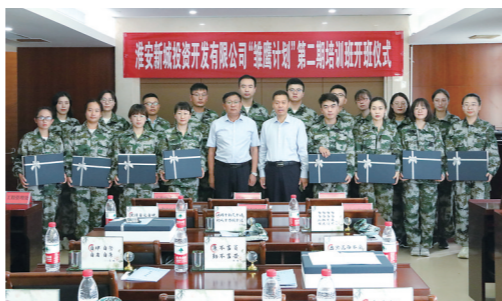
开展“雏鹰计划”新员工入职培训